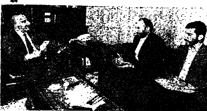
... ومع القائم بأعمال إيران (اسماعيل حداد)

استقبل رئيس المجلس النيابي السيد حسين الحسيني عند الساعة عشرة من قبل سفير صنعاء والقائم بالأعمال الإيراني السيد احمد محمد التوفيق وعرض معه الوضع في لبنان والعلاقات الثنائية.